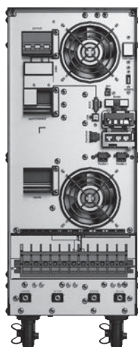
ZT 20 Rear View