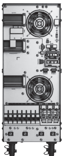
ZTM 40 Rear View